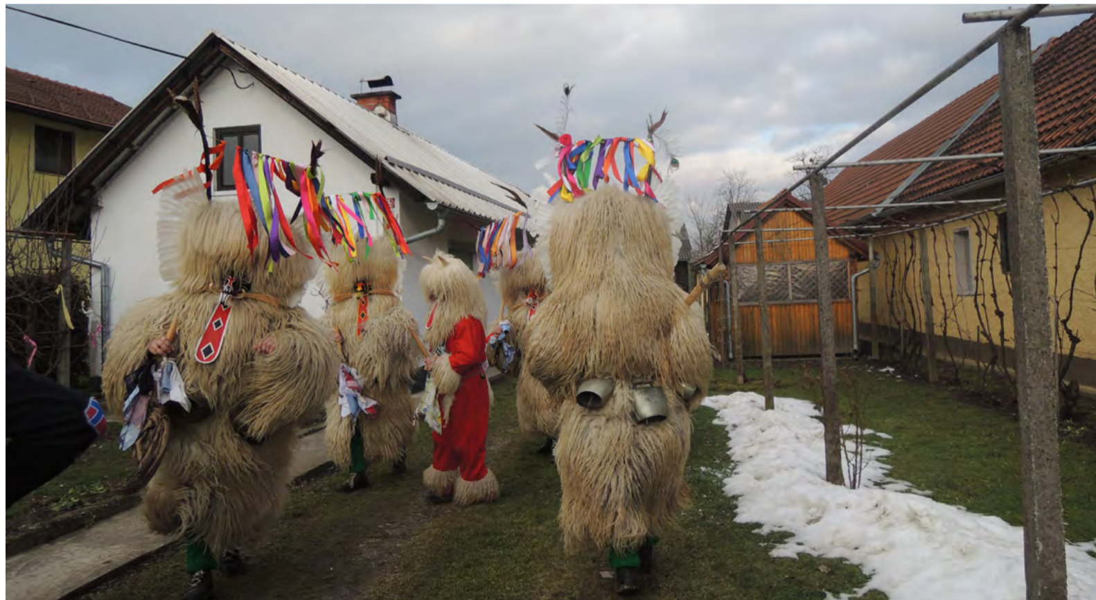
Obhodi kurentov, Markovci 2015

Med mehanizme za varovanje nesovne kulturne dediščine na mednarodni ravni sodijo trije Unescovi sezname: Reprezentativni seznam nesovne kulturne dediščine človeštva , Register dobrih praks varovanja nesovne kulturne dediščine in Seznam nesovne kulturne dediščine , ki jo je potrebno nemudoma zavarovati. Slovenija ima doslej štiri vpise na Reprezentativnem seznamu. Poudarek je na sedanjosti, vpisuje se le dediščino, ki je živa med ljudmi, pred oddajo nominacije pa mora biti element vpisani v nacionalni register. Nominacijo lahko odda posamezna država ali več držav skupaj.