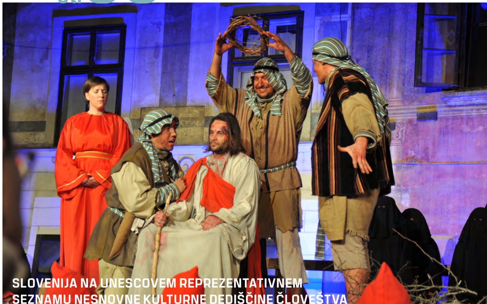
SLOVENIJA NA UNESCOVEM REPREZENTATIVNEM SEZNAMU NESNOVNE KULTURNE DEDIŠČINE ČLOVEŠTVA

Škofjeloški pasijon, Škofja Loka 2015