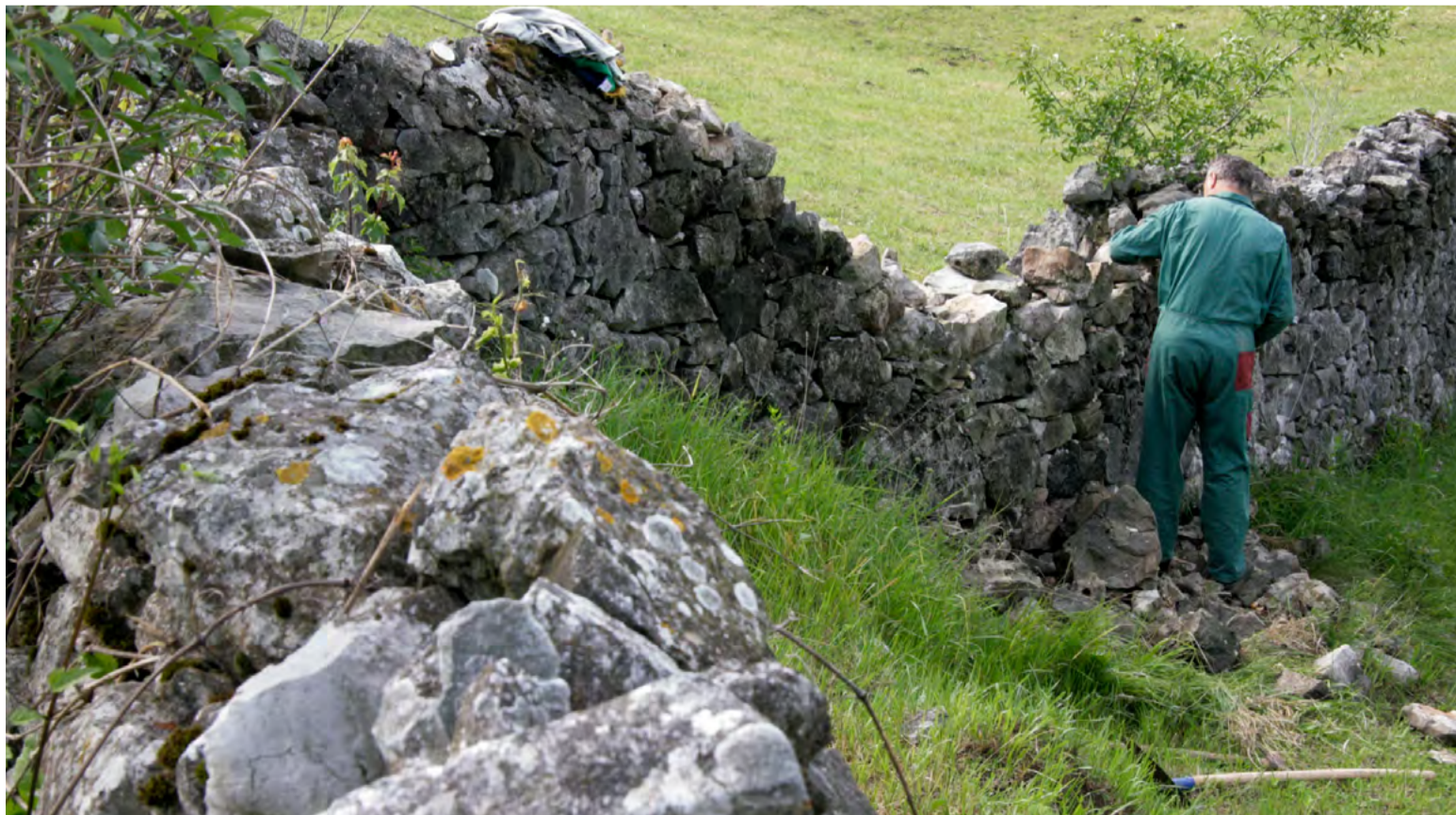
Suhozidna gradnja, Matavun 2012

Avtorica: dr. Nena Židov, Slovenski etnografski muzej