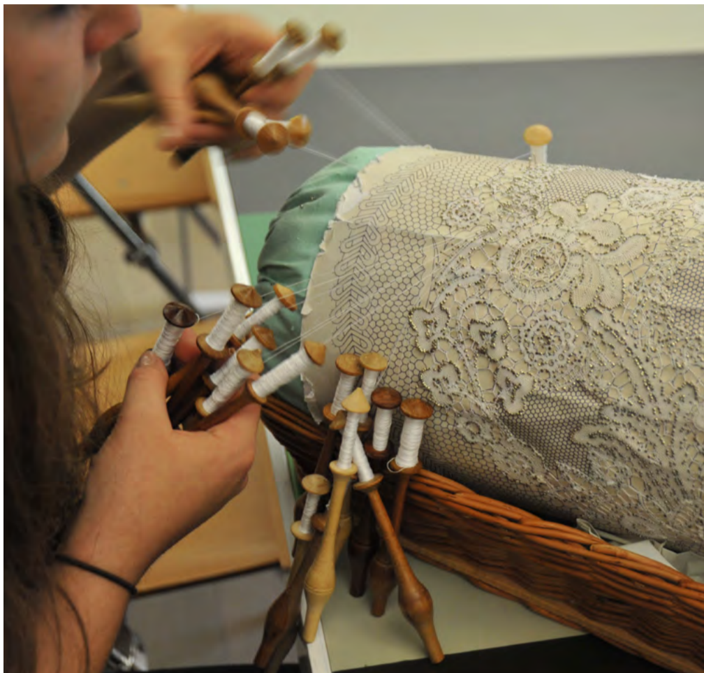
Klekljanica, Ljubljana 2015

Klekljanje čipk v Sloveniji, rokodelska veščina, povezana z izdelovanjem čipk, je bilo vpisano leta 2018. Za izdelavo čipk so potrebni kleklji, blazina v pleteni košarici ali lesenem podstavku, papirnati vzorec, sukanec, bucike, kvačka, škarjice in strojček za navijanje sukanca na kleklje. Čipke izdelujejo iz lanenih in bombažnih niti, naravne svile, volne, umetnih vlaken in kovinskih niti. Poleg tradicionalne rabe, kot je krašenje oblačil ter cerkvenega in hišnega tekstila, so čipke danes v rabi tudi kot modni dodatki in stensko okrasje. So inspiracija za umetniško ustvarjanje v modi, oblikovanju in arhitekturi. Ob koncu 20. stoletja se je klekljanje zelo razširilo po vsej Sloveniji kot prostočasna dejavnost in redkeje kot vir zaslužka. Obstaja okoli 120 klekljarskih društev, sekcij in skupin. Klekljajo zlasti ženske, med katerimi so večinoma šoloobvezna dekleta in upokojenke. S klekljanjem povezana znanja in veščine se najpogosteje prenašajo z babic na vnuke, s pomočjo šol, tečajev in krožkov. Znanje klekljanja ohranjajo in posredujejo čipkarske šole v Idriji, Žireh in Železnikih. Klekljanje predstavljajo na čipkarskih festivalih, kot so Čipkarski dnevi v Železnikih, Festival idrijske čipke in Slovenski klekljarski dnevi v Žireh. Klekljanje, ki je v preteklosti predstavljalo dodaten vir dohodka, je danes pomemben povezovalni element in prilika za druženje.